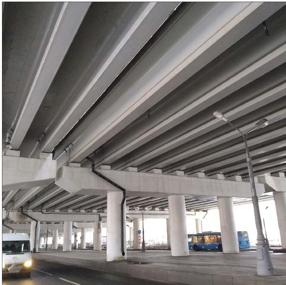
Планируемые две эстакады шириной 29 м через ж/д станцию «Бескудниково»