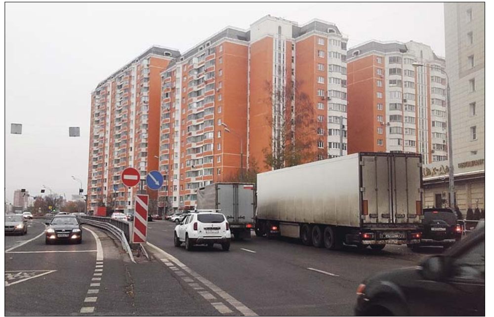
Построенный участок Дублёра МКАД — улица Талдомская

Рядом с домом по адресу ул. 800-летия Москвы, д. 2, корп. 2. проектом планировки Магистральной предусмотрено строительство одноуровневой развязки с расширением проезжей части и вырубкой многолетних зелёных насаждений. Кроме того, в районе пересечения Дмитровского шоссе и ул. 800-летия Москвы проектом планировки предусмотрено строительство эстакады, которая пройдёт в непосредственной близости от жилых домов, нижние этажи которых при этом окажутся ниже уровня эстакады.